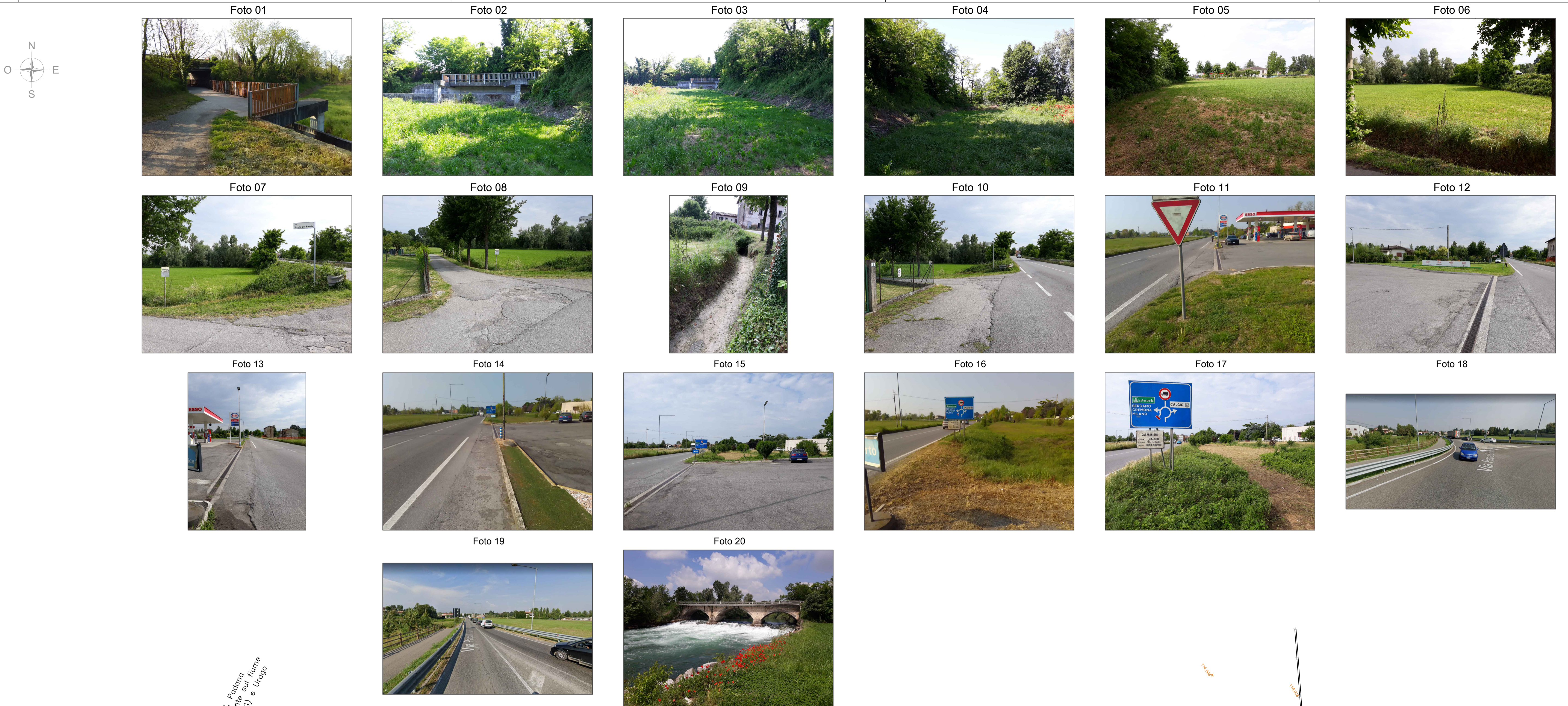
I rilievi sono integrati con quelli forniti dalla committenza, elaborati da GON S.r.l. S.t.p. — Confine comunale